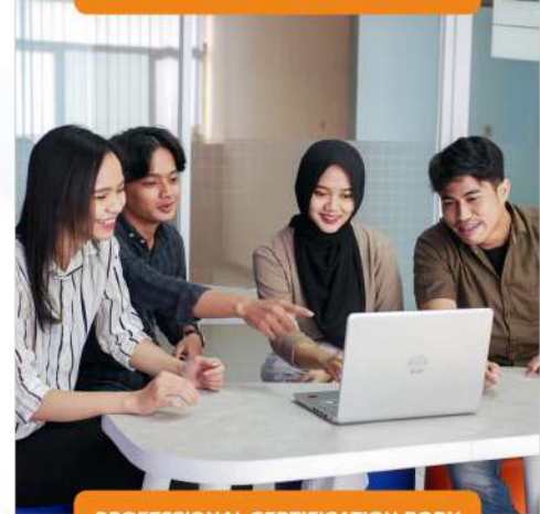
PROFESSIONAL CERTIFICATION BODY