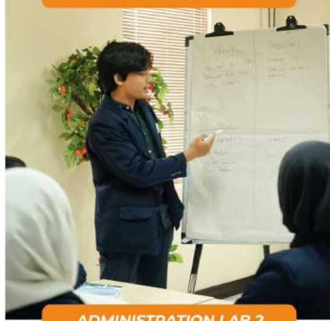
ADMINISTRATION LAB 2