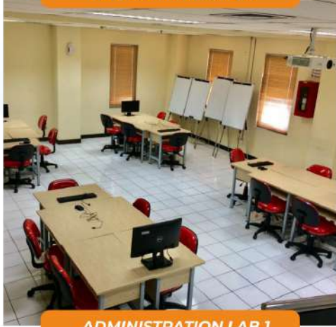
ADMINISTRATION LAB 1